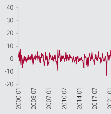
Zmiana cen paliw (% m/m)