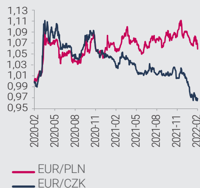
Kurs EUR/PLN i EUR/CZK (1=02.2020)